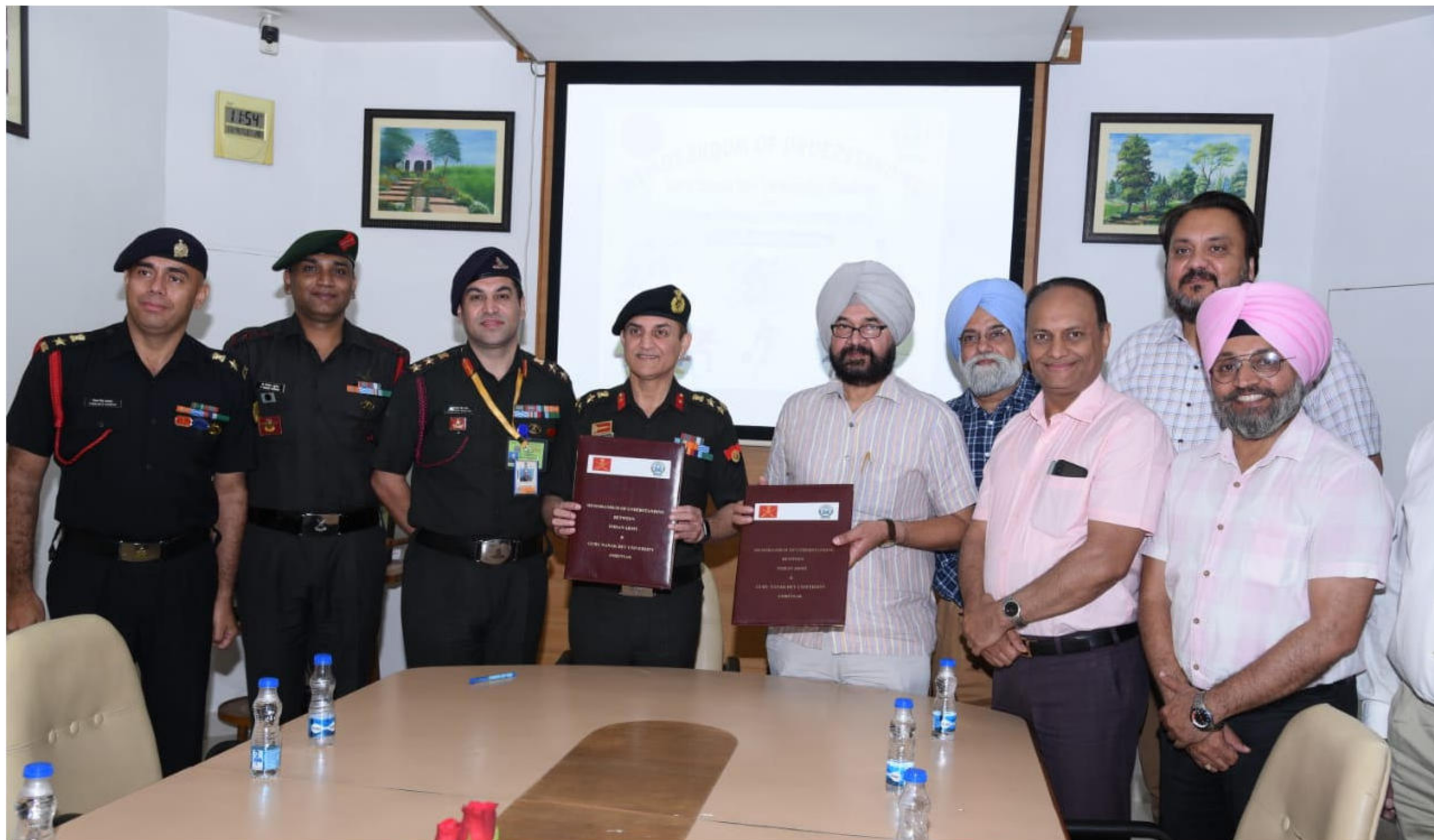
MOU BETWEEN GURU NANAK DEV UNIVERSITY AND MISSION OLYMPICS WING OF INDIAN ARMY