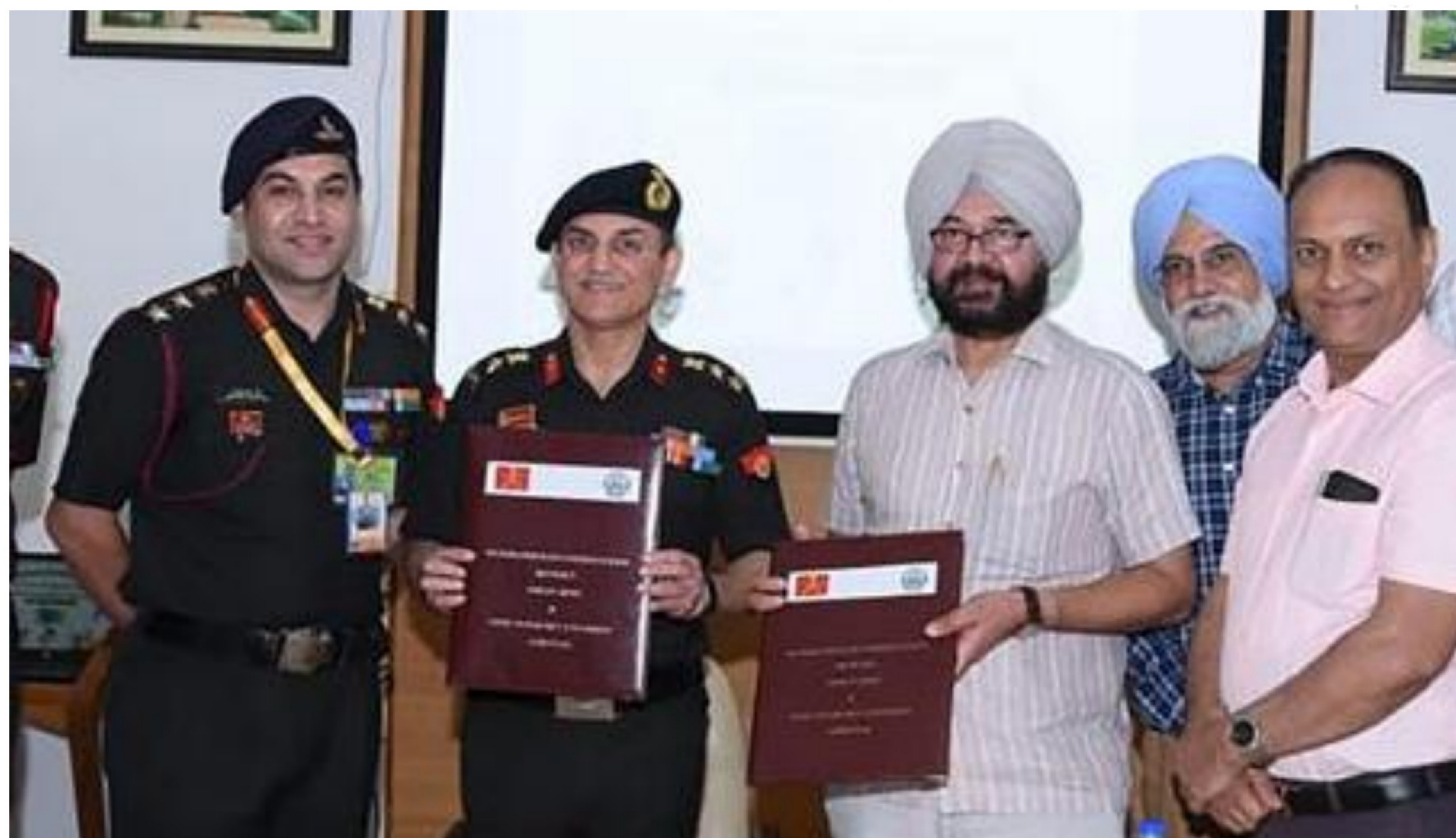
The pact aims to facilitate the educational progression of outstanding sports personnel.